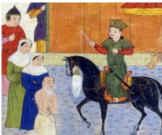
تصویر ۵: مقنعه، جامع التواریخ، نیمه اول سده هشتم ق، برگرفته از (عکاشه، ۱۳۸۰: ۱۱۵).

نمونه دیگر مقنعه در نگاره‌ها، از دو قسمت تشکیل شده؛ تکه روی سر این نوع پوشش یا کوتاه است یا تا پشت زانو امتداد می‌یابد. این سرپوش در نقاشی‌هایی که از داستان‌های پیامبران ترسیم شده است بر سر زنان دیده می‌شود و در تصویر شماره ۵ از جامع التواریخ که ولادت حضرت محمد (ص) را نشان می‌دهد قابل مشاهده است.