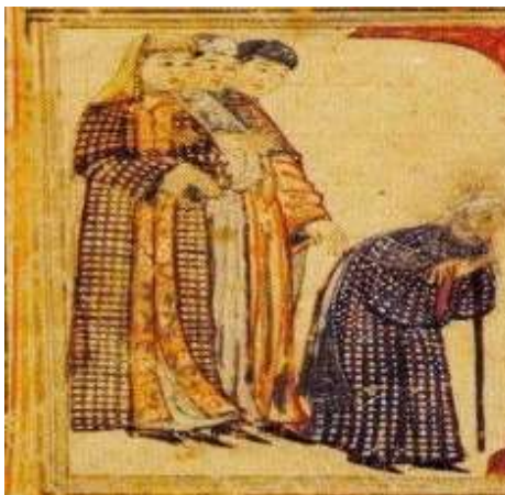
تصویر ۱۳: کفش، جامع‌التواریخ، نیمه اول سده هشتم ق، برگرفته از (عکاشه، ۱۳۸۰: ۱۱۵).

در مکاتبات رشیدی به همراه کفش ذکری از موزه تیماج (منظور کفش ساق‌بلند از پوست بز می‌باشد) برای ساکنان ربع رشیدی به میان آمده است در حالیکه برای مزارعان تنها از کفش نام برده شده است (همدانی، ۱۹۴۵: ۱۹۵). بنابراین موزه پای‌پوش اقشار بالای جامعه بود. ابن بطوطه نیز می‌نویسد که زنان شیرازی موزه به پا می‌کردند (ابن بطوطه، ۱۳۷۰، ج ۱: ۲۵۱). کلمه‌ای که او بکار برده خُف می‌باشد که به معنی نوعی پوتین تا ساق پاست (دزی، ۱۳۸۸: ذیل سَرْمُوز). می‌توان شکل کلی پای‌پوش یک زن را در تصویر ۱۳ از جامع-التواریخ دید. برخلاف مردان که در نگاره‌ها موزه‌های رنگارنگ در پای دارند، پای‌پوش زنان تماماً سیاه رنگ هستند.