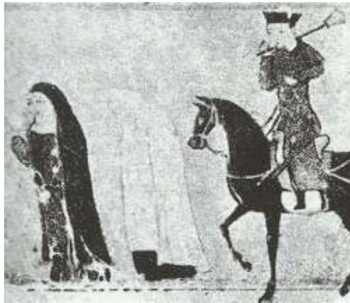
تصویر ۷: چادر، جامع‌التواریخ، نیمه اول سده هشتم ق، برگرفته از (عکاشه، ۱۳۸۰: ۱۱۴).