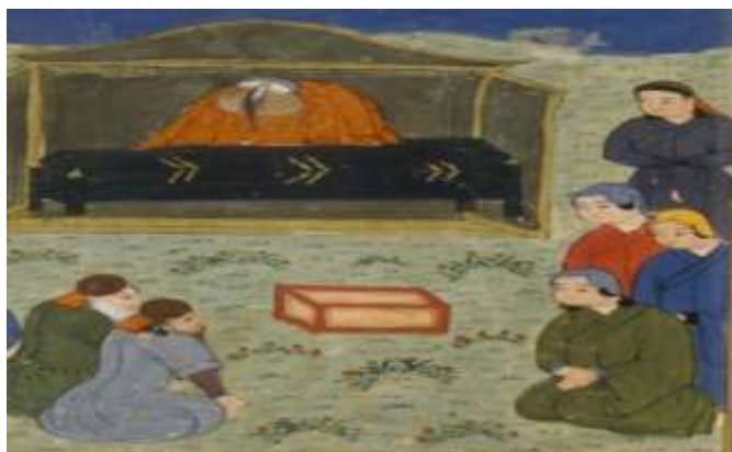
تصویر ۱۸: پوشش عزاداری زنان در مرگ هلاکوخان، جامع/التواریخ، نیمه اول سده هشتم ق، برگرفته از (همدانی، ۱۳۷۳، ج ۴).

به نظر می‌رسد زنان ایرانی به دلیل حفظ حجاب اسلامی در خصوص پوشش‌های سر از سرپوش‌های مغولی الهام نگرفته‌اند و شواهدی که از منابع مکتوب و نیز مشاهداتی که از نگاره‌ها حاصل گشته و پیشتر بدان اشاره شد نشان می‌دهد که اغلب زنان ایرانی راعی حجاب بوده‌اند. اما در خصوص تن‌پوش‌ها لباس زنان ایرانی از دو نظر از لباس‌های زنان مغول که آن هم تحت تأثیر الگوهای چینی بود متأثر شده است. قباهای زنان در پیش از دوران ایلخانان تماماً آستین‌هایی تنگ داشتند که در محل مچ دست کاملاً چسبان بود و در نگاره‌ها به ندرت قباهایی که آستین آن در محل مچ دست گشاد باشد مشاهده می‌شود (چیت ساز، ۱۳۷۹: ۲۸۴). در حالیکه احتمالاً تحت تأثیر الگوهای لباس‌های چینی که لباس زنان مغول در ایران را شکل داده بود، لباس زنان ایرانی در دوره ایلخانی به قباهایی با آستین‌های گشاد - تصاویر ۵، ۷ و ۱۱- یا بسیار گشاد - تصاویر ۴، ۶، ۱۳ و ۱۴- مبدل شده است. همان‌گونه که در نگاره‌های برجای مانده از زنان درباری مغول - تصاویر ۱، ۲، ۹ و ۱۸- هم لباس رویی زنان آستین‌هایی بسیار گشاد دارد.