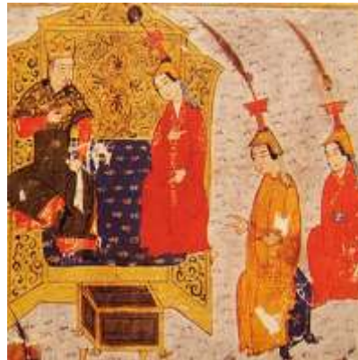
تصویر ۱: بوقتاق، جامع‌التواریخ، نیمه اول سده هشتم ق، برگرفته از (همدانی، ۱۳۷۳، ج ۴).

بوقتاق در فرهنگ مغول جایگاهی خاص و کاربردهایی ویژه داشت. این سرپوش تاج ملکه به شمار می‌رفت و در روز تاج‌گذاری بر سر اولین همسر خان نهاد می‌شد: «...روز یکشنبه بیست و ششم (ذی القعدة سال ۷۰۴ ق) بر سر قتلغشاه خاتون دختر امیر ایرنجین بوغتاق نهادند...» (قاشانی، ۱۳۴۸: ۴۴). استفاده دیگر این سرپوش در زمانی بود که یک قوما - زن غیر رسمی - بنابر شرایطی در ردیف خاتون‌ها قرار می‌گرفت و ارتقاء مقام می‌یافت. چنانچه در جامع‌التواریخ آمده است: «... اباقخان توقیتی خاتون را که قومای هلاکوخان بود با خود گرفت و بجای توقوز خاتون بوغتاق بر سر نهاد و خاتون شد.» (همدانی، ۱۳۷۳، ج ۲: ۱۰۵۵) یا «...مادر او قومایی بوده... و بعد از مدتی بوغتاق بر سر نهاد...» (همدانی، ۱۳۷۳، ج ۲: ۹۶۸).