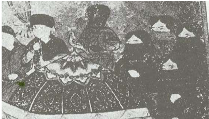
تصویر ۱۷: پوشش عزاداری زنان در مرگ غازان خان، جامع‌التواریخ، نیمه اول سده هشتم ق، برگرفته از (بیانی، ۱۳۸۸: ۱۵۶).

احتمالاً زنان مغول در ایران بعد از گروش به اسلام به نوعی از فرهنگ پوشش اسلامی متأثر شده‌اند اما به ندرت در نگاره‌ها چنین تأثیری قابل ردیابی است. به طور بارز و مشخص در یک مورد از نگاره‌ها تأثیر فرهنگ اسلامی در پوشش زنان مغول به چشم می‌خورد. در نگاره شماره ۱۷ از جامع‌التواریخ که نشانگر مرگ غازان خان است، چهار همسر او در پشت تابوت ایلخان ایستاده‌اند و روبنده بر صورت بسته‌اند، در حالیکه در تصویر ۲ این زنان در کنار غازان بوقناق بر سر نهاده‌اند. استفاده از روبنده از تأثیرات پوشاک ایرانی-اسلامی است چراکه در نگاره شماره ۱۸ برگرفته از جامع‌التواریخ که مرگ هلاکوخان را نشان می‌دهد، هیچ زنی روبنده‌ای بر صورت ندارد.