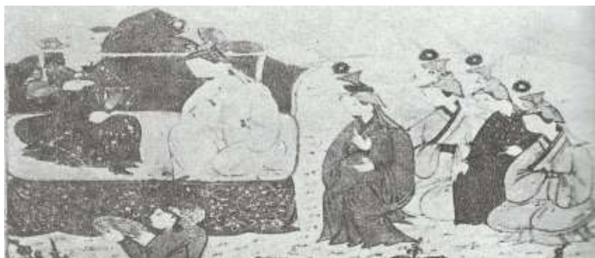
تصویر ۲: بوقناق سربپوش خاتون‌های غازان خان، جامع/تواریخ، نیمه اول سده هشتم ق، برگرفته از (بیانی، ۱۳۸۸: ۱۵۵).

زنان مغول هیچ‌گاه بدون سربپوش خارج نمی‌شدند و حداقل دستمالی بر سر می‌بستند (اشپولر، ۱۳۹۲: ۴۴۳).