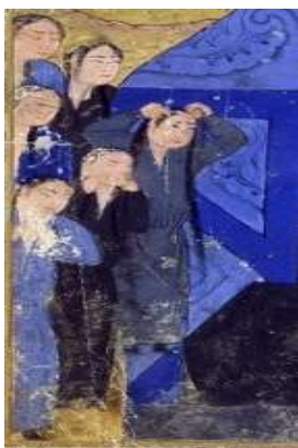
تصویر ۱۰: نوع دیگر تن پوش زنان مغول، جامع‌التواریخ، نیمه اول سده هشتم ق، برگرفته از (همدانی، ۱۳۷۳، ج ۴).

اختلاف در قدرت خرید پوشاک و تهیه آن در بین طبقات مختلف اجتماعی مهم‌ترین عاملی است که پوشاک را به عنوان یکی از نشانه‌های شاخص اختلاف طبقاتی مطرح ساخته است. به همین دلیل ارتباط مستقیمی میان نوع پوشاک و دیگر ویژگی‌های فرد وجود دارد و گاه انتخاب یک نوع خاص از پوشاک اصرار بر نمایش برتری شخص نسبت به عموم مردم است (پاکتچی، ۱۳۸۵، ج ۱۴: ۴۴). دو لباس گران‌بهای طبقات بالای اجتماعی در دوره ایلخانی جامه‌های نخ و نسیج بود (جوینی، بی‌تا، ج ۱: ۱۷۶). جامه نسیج دوخته شده از پارچه‌ای پرپها در روزگار ایلخانان بود که این پارچه از ابریشم و طلا ساخته می‌شد (Kadoi, 2009: 21). ابن بطوطه نخ را جامه حریر مذهب و نسیج را حله‌ای مرصع به جواهر دانسته است (ابن بطوطه، ۱۳۷۰، ج ۱: ۴۰۵ و ۴۲۰). استفاده از این قسم پارچه‌ها در تولید لباس را می‌توان به عنوان میراث زندگی کوچ نشینی به شمار آورد. کوچ نشینان ثروتمند آسیای مرکزی لباس‌هایی رویی خود را با طلا تزئین می‌کردند (Kadoi, 2009: 21).