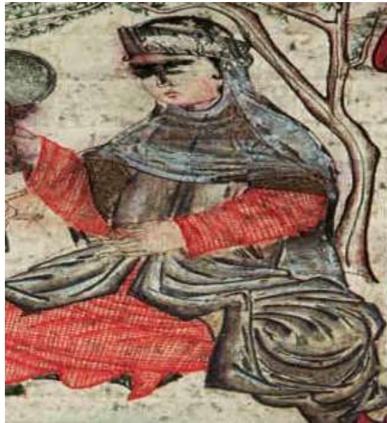
تصویر ۱۱: قمیص و قبا، جامع‌التواریخ، نیمه اول سده هشتم ق، برگرفته از (تجویدی، ۱۳۷۵: ۷۲).

در شعر حافظ کمربندی که بر روی قبا بسته می‌شد قَصَب نامیده شده است: