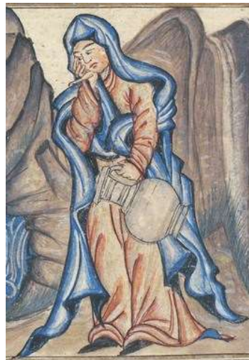
تصویر ۸: چادر، جامع‌التواریخ، نیمه اول سده هشتم ق، برگرفته از (اقبال، ۱۳۸۴: ۴۹).