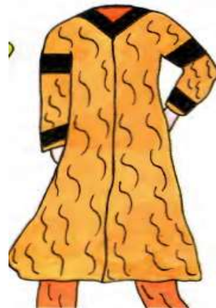
تصویر ۱۹: نمونه‌ای از قباهای قبل از دوران ایلخانان، برگرفته از (چیت‌ساز، ۱۳۷۹: شکل ۴۸۵).

اما لباس زنان در دوره ایلخانی؛ چه لباس زنان مغول و چه لباس زنان ایرانی بسیار بلند بود، به نحوی که در نگاره‌ها شلوار و در برخی موارد حتی کفش زنان قابل رویت نیست. نمونه‌ای از قباهای کوتاه‌تر در نگاره‌های بر جای مانده از دوران ایلخانی مشاهده نشد. شکلی از قباهای متداول در پیش از دوران ایلخانان که قدی کوتاه و آستین‌هایی چسبان داشت در تصویر ۱۹ قابل مشاهده است.