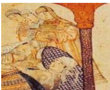
تصویر ۶: مقنعه، جامع التواریخ، نیمه اول سده هشتم ق، برگرفته از (همدانی، ۱۳۷۳، ج ۴).

شده پوشیده...» (ابن بطوطه، ۱۳۷۰، ج ۱: ۴۰۵). این نوع از مقنعه را در تصویر شماره ۶ از جامع التواریخ بر سر زنانی که در مقابل غازان خان ایستاده‌اند می‌توان مشاهده نمود.