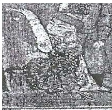
تصویر ۴: مقنعه و پیشانی‌بند، شاهنامه مکتوب، اوایل سده هشتم ق، برگرفته از (پوپ، ۱۳۳۸: ۱۷۰).

نمونه دیگر مقنعه در نگاره‌ها، از دو قسمت تشکیل شده؛ تکه روی سر این نوع پوشش یا کوتاه است یا تا پشت زانو امتداد می‌یابد. این سرپوش در نقاشی‌هایی که از داستان‌های پیامبران ترسیم شده است بر سر زنان دیده می‌شود و در تصویر شماره ۵ از جامع التواریخ که ولادت حضرت محمد (ص) را نشان می‌دهد قابل مشاهده است.