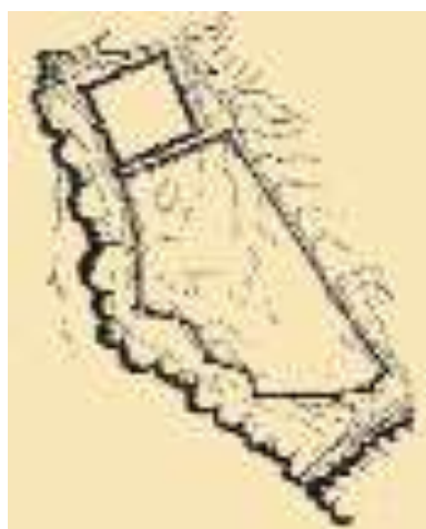
پلان قلعه یزآباد نخبوان

(Naxçıvan ensiklopedyası, c2, 2005, s356).