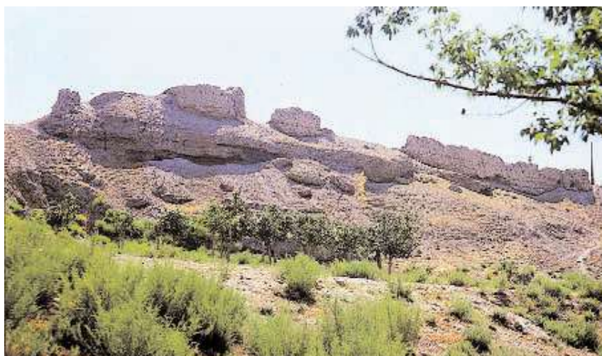
بقایای قلعه یزآباد نخبوان

(Naxçıvan ensiklopedyası, c2, 2005, s356).