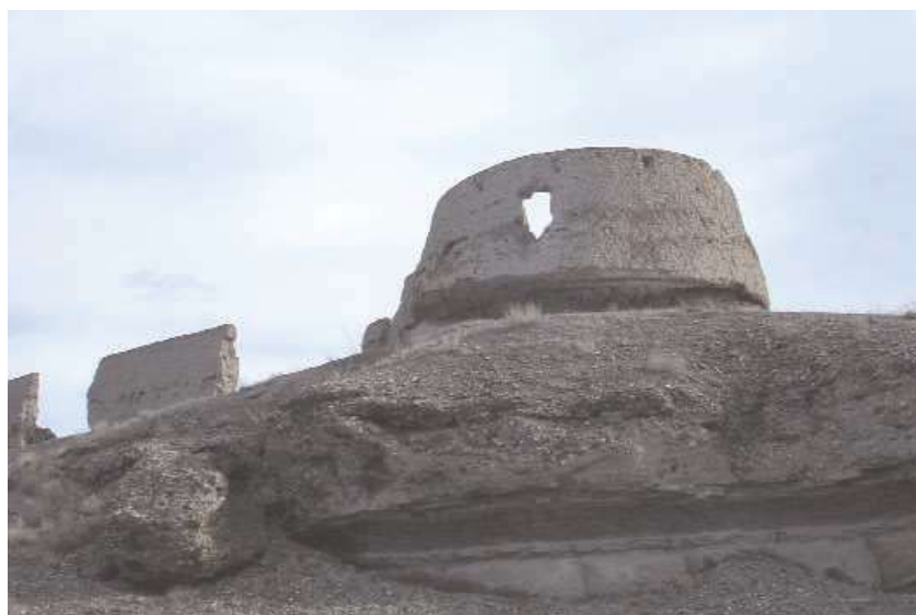
بقایای قلعه یزدآباد نخجوان (Naxçıvan abidələri ensiklopediyası, 2008, s 225)