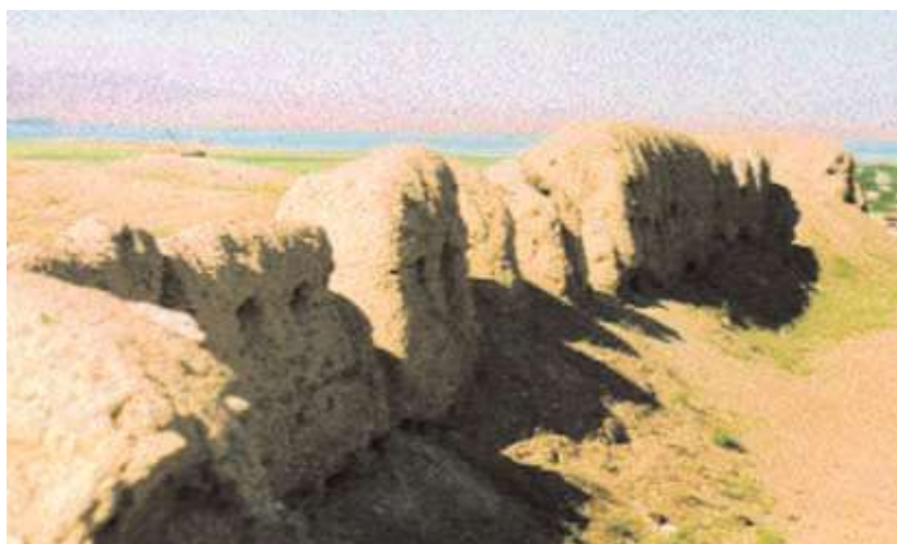
بقایای قلعه یزدآباد نخجوان (Naxçıvan abidələri ensiklopediyası, 2008, s 225).