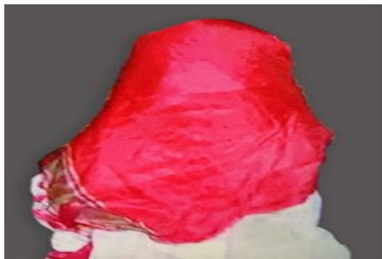
عکس ۲-۷. توتوق، اوزتوتار. ۱

- توتوق، اوزتوتار (tutugh -uz Tutar): دستمال بزرگ حریری که برای پوشاندن چهره عروس به کار می‌رفت. (کوهستانی اسبق سو. مصاحبه، ۵ آذر ۱۳۹۸)، (عکس ۲-۷).