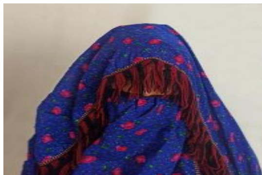
عکس ۳-۶. یاشماق، یالق ۲

در بین زنان ترکمن نماد احترام که دنباله قی قاج است و جلوی دهان گرفته می‌شود و انتهای آن به وسیله بند مربوطه بافته شده از نخ و ابریشم یا به وسیله منجوق به تویی وصل می‌شود (عکس ۳-۶)