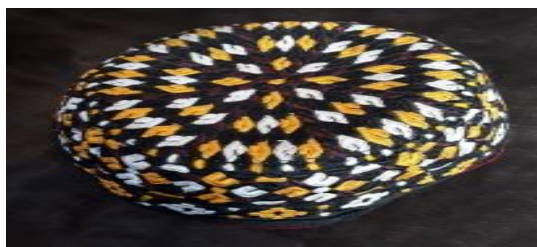
عکس ۳-۱. کلاه، بورک (طاقیه یا تخیه). ۱

به‌طور کلی کلاه دختران پیش از ازدواج به نام‌های تاسه‌ک، تاسرک، طاخیه، طاقیه و یا بوروک نیم‌کره‌ای بوده و هست که گاه سکه‌های نقره‌ای بسیار روی آن‌ها دوخته می‌شود. عرقچین دختران کمی بلندتر از عرقچین مردهای ترکمن است. اکنون دختران ترکمن عرقچین‌های روزانه‌ای بر سر می‌گذارند که هیچ نوع زینتی ندارد و به‌وسیله روسری (چارقد) پوشیده می‌شود (معطوفی، ۱۳۸۳: ج ۳/ ۲۳۰۸).