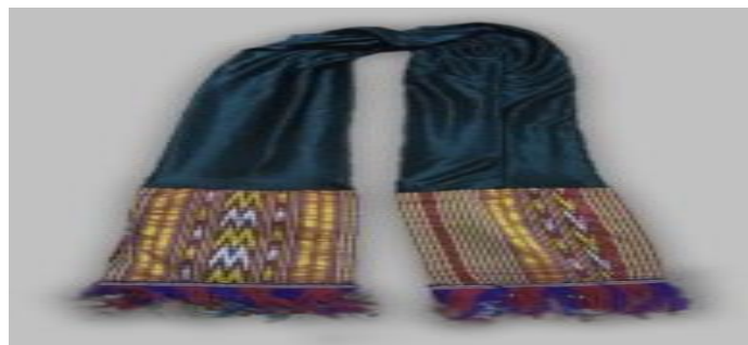
عکس ۳-۳. پیشانی‌بند.

- پیشانی‌بند (Pesni band): دختران ترکمن پس از ازدواج به‌جای کلاه از سربندهایی که به‌صورت خاصی دور سر پیچانده می‌شود، استفاده می‌کنند. به سربند زنان عموماً «آلین‌دانگی» گفته می‌شود. نحوه بستن این سربند در میان طوایف مختلف ترکمن متفاوت بوده (رستمی و میر، ۱۳۹۶: ۷۲). ترکمن‌های نخورلی از این پیشانی‌بند بهره می‌برند. پیش از حرکت عروس به خانه شوهر، تاج عروس را بر سر او می‌گذارند. این تاج عروس (آلین‌دانگی) از نی‌های بسیار ریز شبیه جارو بافته شده‌است و به دور آن پارچه‌ای می‌کشند، سپس زیور پیشانی (آلین‌شای) را به آن وصل می‌کنند (گلی، ۱۳۶۶: ۳۱۸). این پیشانی‌بند در میان طوایف گوناگون ترکمن به شکل‌ها و اندازه‌های متفاوتی دیده می‌شود و زنان طوایف با توجه به سن و سال از انواع آن استفاده می‌کنند. در گذشته، نوعروسان در برخی نقاط، از پیشانی‌بندهای بلند استفاده می‌کردند به‌تدریج که به میان‌سالگی می‌رسیدند، به ازای هر سال حدود دو انگشت از ارتفاع آن کاسته می‌شد وقتی کوتاه می‌شد به آن تارک می‌گفتند (محمّدی، ۱۳۸۸: ۸۱). در این مرحله پیشانی‌بند زنان به رنگ سیاه درمی‌آید که نشانه پختگی، کارکشتگی و مجرب بودن آن‌ها است (عکس ۳-۳).