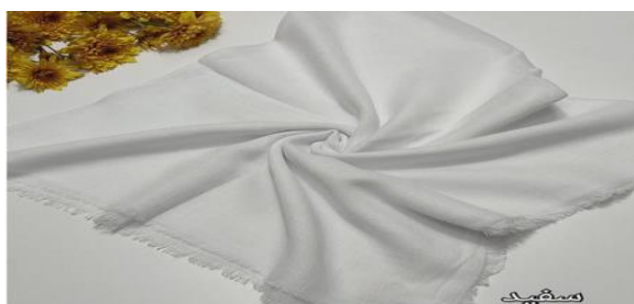
عکس ۲-۴. یای لقی یا یاغلیق (چرقت).

- یای لقی یا یاغلیق (چرقت) (Yayleq Yagleq): زنان ترک از یایلیق یا چارقد، چرقت، از پارچه‌های ابریشمی چهارگوش یا سه‌گوش سفید که بافت قواره‌ای و طرح‌های به خصوصی به خود داشت (عکس ۲-۴). به‌عنوان روسری زنانه استفاده می‌کنند (سالاریان، ۱۳۹۸: ۸۶). روی آن سربندی به نام شاماخی می‌بندد رنگ آن سفید است.