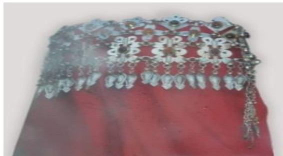
عکس ۱-۷. روبند عروس.

- روبند عروس: رسم است بر سر عروس پس از پوشاندن کامل پوشاک او، روبند سرخ‌رنگی می‌اندازند. به گفته افراد محلی استفاده از روبند سرخ‌رنگ سال‌ها بین این قوم رواج داشته‌است (شادکام، مصاحبه، ۲ آبان، ۱۴۰۰). رنگ سرخ تحریک‌کننده و نشاط‌آور است و نماد جشن و سرور است (کوپر، ۱۳۷۹: ۱۷۳-۱۶۹). این روبند از جنس ابریشم است که تمام تن عروس را می‌پوشاند و با قطعه تزئینی که معمولاً جنس آن نقره است و سلسله یا زلزله نامیده می‌شود، در قسمت پیشانی و سر بسته می‌شود (عکس ۱-۷).