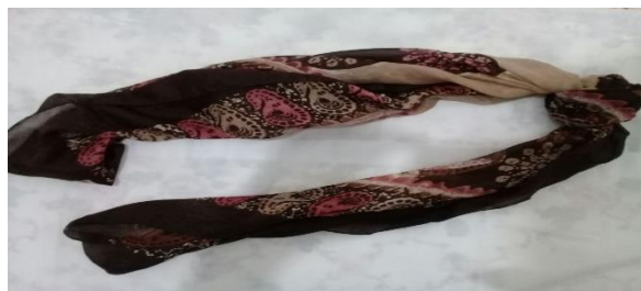
عکس ۲-۶. قَسْوَه یا قَصَبَه. ۲

- قَسْوَه یا قَصَبَه (Ghes sevah): به روسری‌هایی با انواع طرح و رنگ گفته می‌شود که زنان ترک در مناطقی همچون شیروان و شهر غلامان به دور سر عروس می‌بستند. ابتدا این روسری را از دو طرف جمع می‌کردند از قسمت وسط دو گره می‌زدند تا میان آن برجستگی ایجاد شود (روحانی. مصاحبه، ۱۲ دی، ۱۳۹۸). گره باید درست بالای پیشانی و میان دو ابرو و بخش انتهایی موی پیشانی قرار می‌گرفت و پس از آن روی سر عروس شال قرمز ابریشمی یا پشمی می‌انداختند و از پشت شال به آن سنجاق می‌زدند (عکس ۲-۶).