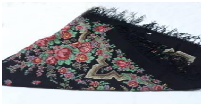
عکس ۳-۴. چارقُد، روسری. ۱

– چارقُد، روسری (Carqad): این سرپند دستمالی گاه با زمینه مشکی و یا به رنگ‌های دیگر با نقش‌های درشت به رنگ زرد و نارنجی بود که بر روی آن، روسری بزرگ‌تری تقریباً به اندازه نصف چادر با ریشه‌های بلند و نقش‌هایی از گل‌های رنگین استفاده می‌کردند (سلوکی، ۱۳۸۵: ۲۶؛ رنج‌دوست، ۱۳۸۷: ۲۶۰؛ یوری، ۱۳۸۹: ۹۰). رنگ‌های به‌کاررفته همچون رنگ قرمز و زرد که رنگ زرد از رنگ‌های نورانی است که کنایه از آرامش، اتحاد، انرژی، خورشید، برداشت محصول، طلوع و خوشحالی است (گرترو، ۱۳۹۵: ۷۳۵) زنان ترکمن هنگام عروسی و یا هنگام رفتن به بیرون از خانه، علاوه بر یالتی و آلدانگی، از شالی بزرگ (چارقت)، روسری‌ها و سراندازهای بزرگ استفاده می‌کردند که در گذشته از جنس ابریشم بود؛ ولی امروزه به‌جای آن از چیت گل‌دار با ریشه‌های بلند مکرومه‌دوزی شده استفاده می‌شود (رنج‌دوست، ۱۳۸۷: ۲۶۲). چارقدهای ترکمنی در قواره‌های بزرگ و با طرح‌های متنوع، کاملاً جلب توجه می‌کند و زیبایی خاصی به زنان ترکمن می‌بخشد (عکس ۳-۴).