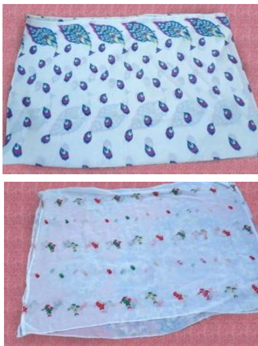
عکس ۱-۱. که وُن ۱ .

نقش طاووس‌ها در حاشیه شال به شکلی است که پس از بستن که وُن بر سر، حاشیه نقش طاووس، از پشت، روی دامن می‌افتد و جلوه زیبایی پیدا می‌کند (شادکام، مصاحبه، ۲ آبان، ۱۴۰۰). تصویر طاووس‌ها ریزه‌کاری زیادی ندارد و همیشه با تاجی که بر سر طاووس هست قابل‌شناسایی است (کاظم‌پور و سلیمانی، ۱۳۹۱: ۵۳). نقش طاووس نماد و نشان‌دهنده تجمل و اشرافیت و شکوه و جلال است (کوپر، ۱۳۷۹: ۲۵۲). این نقش قبل از اسلام نیز مورد توجه بوده‌است (دادور و منصور، ۱۳۹۰: ۱۱۴ و ۱۱۵). احتمالاً بیشتر زنان شیک‌پوش آن را سر می‌کردند.