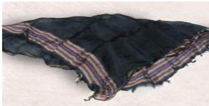
عکس ۲-۲. ایپی دسمال.

- ایپی دسمال (Eipey dasmal): دستمال ابریشمی که به رنگ سیاه و چهارگوش است و با نوارهای گاهی سرخ و یا سیاه، در دو سر ریشه و در مناطقی از خراسان روی عرقچین بسته می‌شود؛ یعنی ابتدا عرقچین را روی سر می‌گذارند، و بعد روسری اصلی را می‌گذارند سپس با دستمال ابریشمی روی عرقچین را می‌بندند (حصاری. مصاحبه، ۱۲ مهر، ۱۳۹۸). به نظر می‌رسد ایپی دسمال ترک‌ها شبیه دستمال هفت‌رنگ کُرم‌انج‌هاست که از نظر رنگ باهم فرق دارد (عکس ۲-۲).