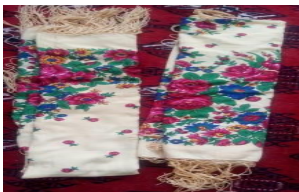
تصویر ۲-۳. ایپ شال. ۱

- ایپ شال (Eip sal): همان شال‌های گل‌دار در رنگ‌های متفاوت، با جنس پشم و دورتادور آن ریشه‌های بلند برای نوعروس‌ها از رنگ قرمز استفاده می‌شود (جواهری، مصاحبه، ۱۳ آبان، ۱۴۰۰). همان‌طور که ذکر شد رنگ قرمز سمبل نشاط و حیات و زندگی است (اتین، ۱۳۶۷: ۲۱۴) (عکس ۲-۳).