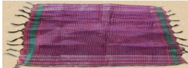
عکس ۱-۲. دستمال هفت‌رنگ. ۱

- دستمال هفت‌رنگ (Dest male haft rang): جزء دیگر سرپوش، دستمال ابریشمی هفت‌رنگ (به ابعاد تقریبی ۵۰ در ۵۰ سانتی‌متر) است که بیشتر دختران و زنان جوان به کار می‌برند. زنان مسن‌تر از دستمال‌های ابریشمی ساده‌تری استفاده می‌کنند که شبیه دستمال‌یزدی است (عکس ۱-۲).