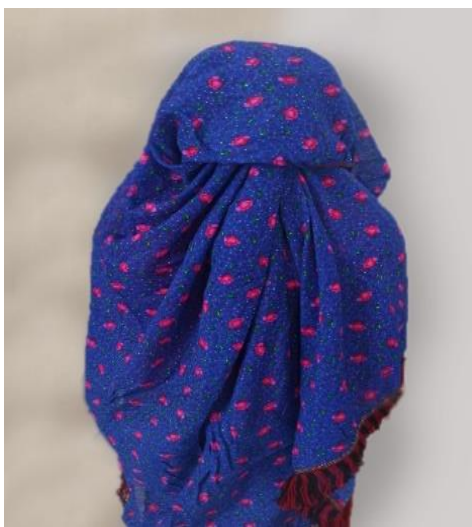
عکس ۳-۵. قی قاج ۱

در بین زنان ترکمن نماد احترام که دنباله قی قاج است و جلوی دهان گرفته می‌شود و انتهای آن به وسیله بند مربوطه بافته شده از نخ و ابریشم یا به وسیله منجوق به تویی وصل می‌شود (عکس ۳-۶)