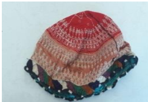
عکس ۱-۳. کُم (کلاه) یا عرقچین. ۲

– شال (shal): از صنایع مهمی که از گذشته‌های دور تاکنون در جغرافیای تاریخی ایران رشد و نمو یافت، شال‌بافی بوده‌است (شعبانی مقدم و دهقان‌نژاد، ۱۳۹۵: ۸۴). اکنون شال‌های گل‌دار پشمی در شهرهایی همچون قوچان، شیروان و بجنورد، جزء اصلی سرپوش