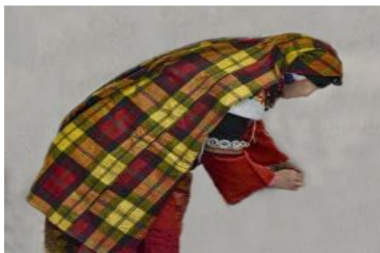
عکس ۲-۵. چَرشو، چَرچ (چادرشب). ۱

- قَسْوَه یا قَصَبَه (Ghes sevah): به روسری‌هایی با انواع طرح و رنگ گفته می‌شود که زنان ترک در مناطقی همچون شیروان و شهر غلامان به دور سر عروس می‌بستند. ابتدا این روسری را از دو طرف جمع می‌کردند از قسمت وسط دو گره می‌زدند تا میان آن برجستگی ایجاد شود (روحانی. مصاحبه، ۱۲ دی، ۱۳۹۸). گره باید درست بالای پیشانی و میان دو ابرو و بخش انتهایی موی پیشانی قرار می‌گرفت و پس از آن روی سر عروس شال قرمز ابریشمی یا پشمی می‌انداختند و از پشت شال به آن سنجاق می‌زدند (عکس ۲-۶).