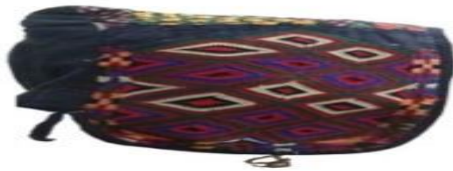
عکس ۱-۸. لیچک.

تکه اضافه نیم‌بیضی‌شکل دارد و روی گوش‌ها قرار می‌گیرد از زیر شال دیده می‌شود (عکس ۱-۸). معمولاً روی این دو تکه را سوزن‌دوزی می‌کنند. زنان برای کامل شدن پوشش سرشان، بر روی این کلاه، شال‌هایی از جنس نخ یا پشم گل‌دار بر سر می‌کنند (شادکام، مصاحبه، ۱۵ مهر، ۱۳۹۸).