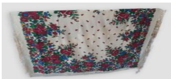
عکس ۱-۴. شال.

زنان روستایی است. این شال‌ها در رنگ‌های قرمز، شیری، سفید، زرد و آبی استفاده می‌شود (مجدی، عربی و شادکام، ۱۳۹۹: ۲۲۸-۲۲۹). معمولاً برای پوشیدن این شال‌ها، یکی از لبه‌های آن را اندکی به درون تا می‌زنند و روی سر قرار می‌دهند؛ سپس یک لبه شال را دور سر می‌پیچانند و در بخش مخالف صورت، زیر لبه شال در کنار صورت محکم می‌کنند (عکس ۱-۴).