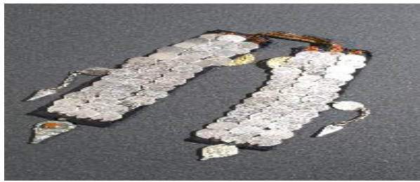
عکس ۱-۶. چنگه. ۱

- چنگه (čanga): جزء دیگر سرپوش زنان لایینی چنگه است. چنگه نواری پهن به عرض هفت تا ده سانتی‌متر است (عکس ۱-۶).