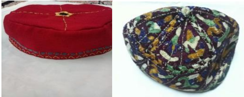
عکس ۱-۲. کولته (عرقچین). ۱

- ایپی دسمال (Eipey dasmal): دستمال ابریشمی که به رنگ سیاه و چهارگوش است و با نوارهای گاهی سرخ و یا سیاه، در دو سر ریشه و در مناطقی از خراسان روی عرقچین بسته می‌شود؛ یعنی ابتدا عرقچین را روی سر می‌گذارند، و بعد روسری اصلی را می‌گذارند سپس با دستمال ابریشمی روی عرقچین را می‌بندند (حصاری. مصاحبه، ۱۲ مهر، ۱۳۹۸). به نظر می‌رسد ایپی دسمال ترک‌ها شبیه دستمال هفت‌رنگ کُرم‌انج‌هاست که از نظر رنگ باهم فرق دارد (عکس ۲-۲).