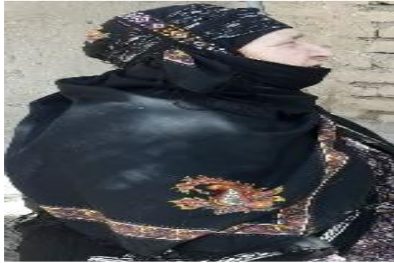
عکس ۱-۵. شار.