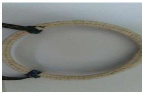
عکس ۳-۸. توپی.