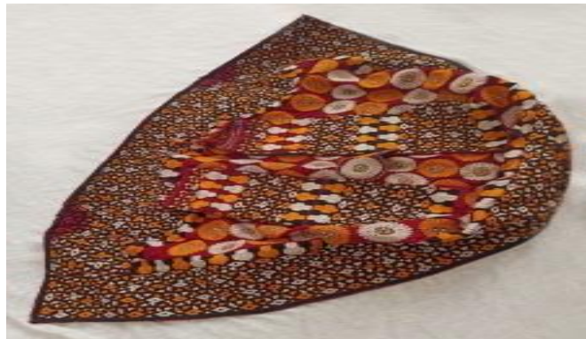
عکس ۳-۷. کورتِه یا چیرپی.

- کورتِه یا چیرپی (Cirpi - Curteh): شل تشریفاتی یا شبه‌آستین‌هایی است که هنوز زنان تکه آن را می‌پوشند و از سمت راست بدن تا زیر بغل سمت چپ می‌افتد. نوعی از آن با آستین‌های گشاد را کورته می‌گویند و به آن بخش آستین‌مانند که آستین نیست، یلک گفته می‌شود و زنان شوهردار بر سر می‌گذارند. جنس آن ابریشمی و دارای طرح‌های زیبایی هندسی به رنگ‌های زرد، سفید، قرمز و سیاه است (اسپونتین فرد. مصاحبه، ۸ اسفند ۱۳۹۸). (عکس ۳-۷).