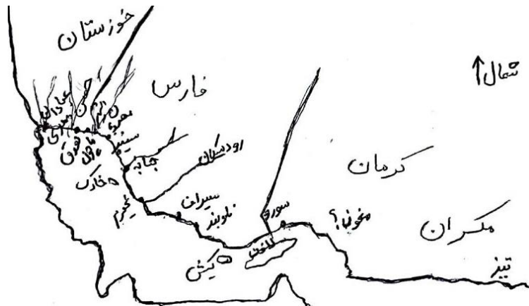
نقشه ۱. پراکندگی شهرهای ساحلی جنوب ایران ۱