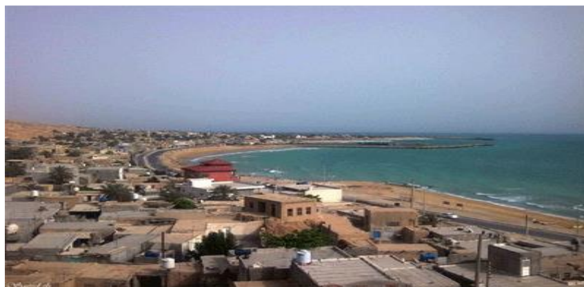
تصویر ۱: بادپناه سیراف ۱

پنج شهر دیگر با هدف برخورداری از مواهب دریانوردی در جنوب ایران شکل گرفتند که دارای موقعیت متفاوتی نسبت به شهرهای پیشین بودند. این شهرها در جزایر خلیج فارس برپا شدند. نام هر یک از آنها مأخوذ از نام جزایری بود که محل تأسیس آنها بودند. شهرهای مزبور به نام‌های خارک، اوال، کیش، لافت و جاشک شهرت داشتند: جزیره خارک روبه‌روی بندر گناوه قرار داشت. اوال در جایی بود که امروزه بحرین نامیده می‌شود. کیش، لافت و جاشک در آب‌های جنوبی خلیج فارس در نزدیکی تنگه هرمز کنونی قرار داشتند.