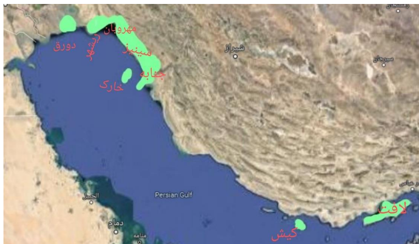
نقشه ۲. پراکندگی شهرهای ساحلی جنوب براساس اراضی حاصل‌خیز ۱

گرمسیری در این شهر «فراخ» بوده است (اصطخری، ۱۳۷۳: ۱۱۳). جزیره خارک که شهرهای با همین نام در آن قرار گرفته بود نیز در قرون نخستین و میانی اسلامی به داشتن «آب‌های خوش و زراعت» شهره بود (جیهانی، ۱۳۶۸: ۵۷). مؤلف نزهةالقلوب به این نکته پرداخته است که در این جزیره «نخیلات و فواکه و غله نیکو» به عمل می‌آید (مستوفی قزوینی، ۱۳۸۹: ۱۳۷). دو جزیره واقع در ناحیه اردشیرخوره نیز به علت وجود خاک حاصل‌خیز شهرهایی را در دامن خود پروراندند. یکی جزیره کیش بود که کشاورزی پررونقی داشت و شهری با همین نام در آنجا تکوین یافته بود. گفته شده در این جزیره نخل فراوانی کشت می‌شده است (ابن‌خردادبه، ۱۳۷۱: ۴۶). یاقوت حموی جزیره مذکور را مملو از باغ و بستان معرفی کرده است (حموی، ۱۹۷۷، ج ۴: ۴۲۲). جزیره ابرکاوان هم دارای مشابهت‌هایی با جزیره کیش بود و به همین دلیل آبادی‌های چندی از جمله شهر لافت در این جزیره تکوین یافت ( حدودالعالم من المشرق الی المغرب ، ۱۳۸۳، ۱۱۲-۱۱۱؛ نک: نقشه شماره ۲).