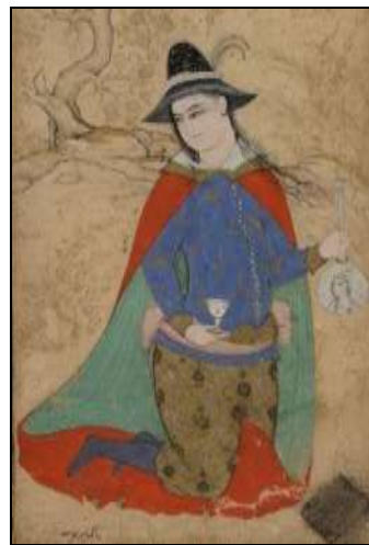
تصویر ۲۶: جوان نشسته در لباس اروپایی با کلاه‌فرنگی، میر یوسف، قرن ۱۱ (ه.ق)، موزه بریتانیا