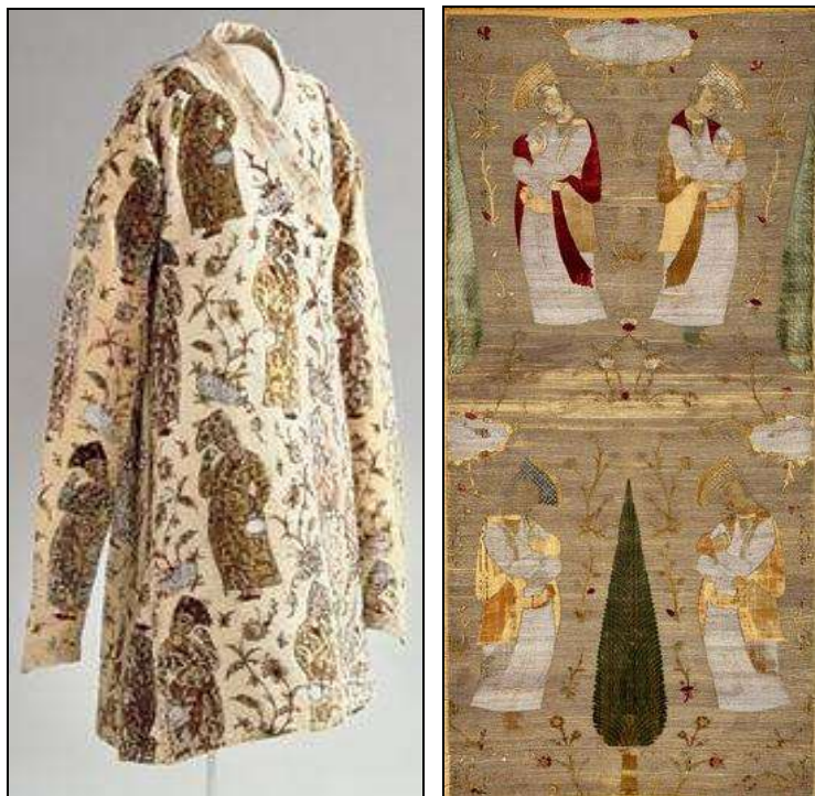
تصویر ۱۱: راست، مخمل با نقوش سبک رضا عباسی، اواخر سده ۱۱، موزه ویکتوریا و آلبرت لندن تصویر ۱۲: چپ، بالاپوش مخمل با زمینه زربفت، استفاده از نقوش نگارگری در تن پوش، موزه زرادخانه سلطنتی استکهلم

در این دوره طرح‌های ماهرانه‌ای از حیوانات و پیکره‌ها برای تزئین منسوجات به کار می‌رفت. طرح بافته‌شده‌ای از تصاویر مردان و زنانی که ردهای چندلایه آن زمان را پوشیده‌اند، نشان‌دهنده سطح بالای هنر طراحی در کارگاه‌های سلطنتی است که به‌عنوان مدل در اختیار بافندگان منسوجات تصویری قرار می‌گرفت (یار شاطر، ۱۳۸۲: ۱۹۸). (تصویر ۱۳ و ۱۴ و ۱۵)