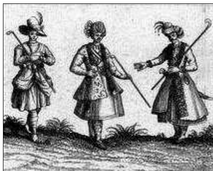
تصویر ۲۰: تن پوش مردان، قرن ۱۱ (ه.ق)، سفرنامه شاردن

تغییرات مشابهی نیز در تن پوش زنان در این دوره به وجود آمد. در تصاویر ارائه شده از قبای بانوان تغییرات به وجود آمده در این پوشاک قابل مشاهده است. قبای بانوان عهد صفوی نیز در نیمه اول بلند بود، که تا مچ پا می‌رسید و کمرشان را محکم نمی‌بستند. (تصویر ۲۱). ولی در نیمه دوم کمر چین و تا پایین زانو می‌رسید و شبیه به قبای مردان در این دوره بوده است (حکیمیان، ۱۳۸۶: ۹۷). (تصویر ۲۲)