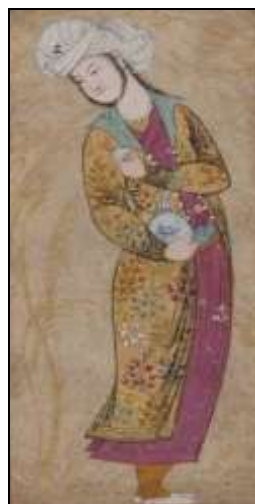
تصویر ۱۴: تصاویر یک آلبوم که نقوش زیبای تن‌پوش را نشان می‌دهد، اوایل قرن ۱۷، موزه متروپلیتن نیویورک