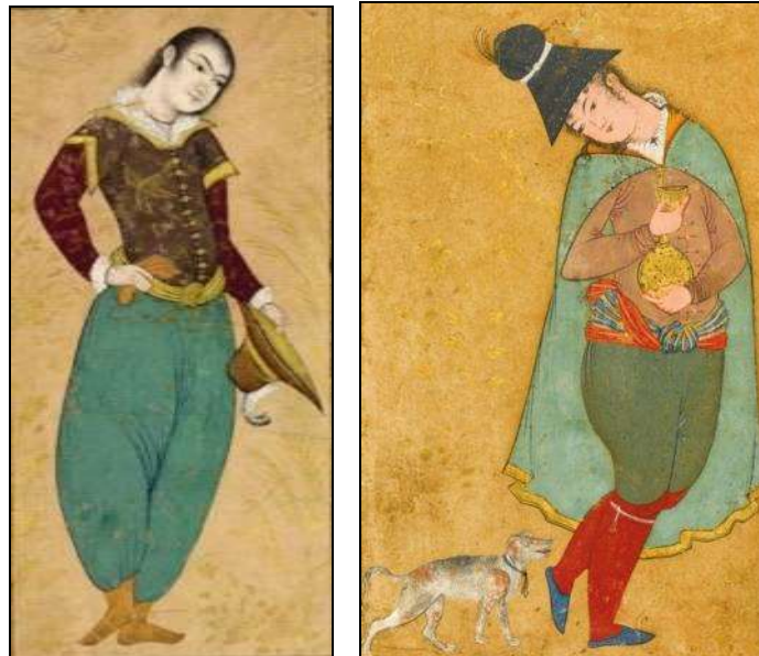
تصویر ۱۶: راست، جوان در لباس اروپایی، رضا عباسی، قرن ۱۱ (ه.ق).