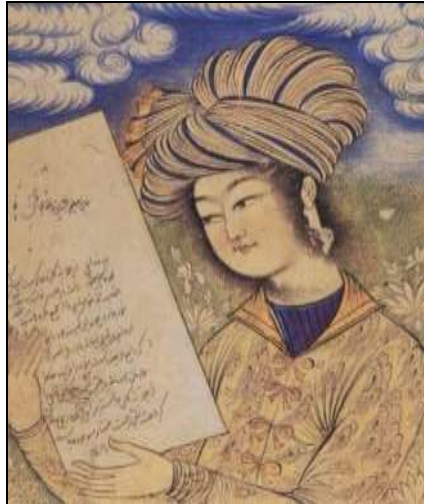
تصویر ۵: برگی از یک مرقع که عمامه یا دستار یک جوان دوره صفویه را می‌نماید، محمدقاسم، قرن ۱۱ (ه.ق)، کاخ گلستان.

این کلاه در دوره بعد گاهی مخروطی شکل و کروی یا بیضی بود و معمولاً با عمامه‌ای پوشانده می‌شد. عمامه شال سفید بلندی بود که به‌گونه‌ای فاخر پیچانده شده بود و به آن، یک نشان پر خروسی مانند بادبزن وصل می‌شد. در اواخر سده دهم هجری، عمامه بلندی متفاوتی داشت، هرچند هنوز بسیار پهن بود و تا اندازه‌ای سفت بسته می‌شد، اما به تدریج پس از سال‌های اولیه قرن بعد، کاملاً شل آویخته شد و با نواری به دو قسمت کاملاً مجزا تقسیم شد و پرها و گل‌های بلندی را داخل آن قرار می‌دادند (پوپ، ۱۳۸۷: ۲۵۹۰). (تصویر ۵ و ۶)