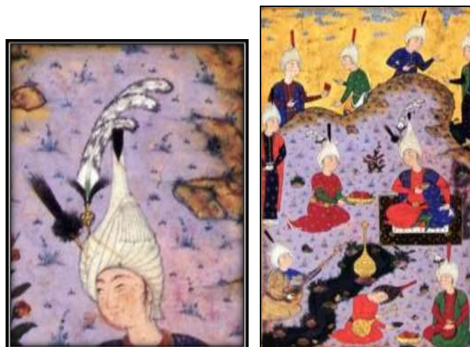
تصویر ۴: تفرج در طبیعت، شاهزاده صفوی با تاج کلاه قزلباش، هنرمند (?)، منتخبات بوستان، سده دهم (هق)، کاخ گلستان.