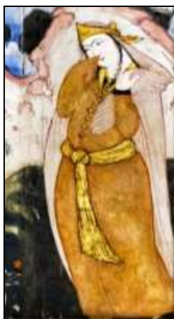
تصویر ۲۱: بخشی از دیوارنگاره کاخ چهل ستون، اوایل قرن ۱۱ (ه.ق).

تغییرات مشابهی نیز در تن پوش زنان در این دوره به وجود آمد. در تصاویر ارائه شده از قبای بانوان تغییرات به وجود آمده در این پوشاک قابل مشاهده است. قبای بانوان عهد صفوی نیز در نیمه اول بلند بود، که تا مچ پا می‌رسید و کمرشان را محکم نمی‌بستند. (تصویر ۲۱). ولی در نیمه دوم کمر چین و تا پایین زانو می‌رسید و شبیه به قبای مردان در این دوره بوده است (حکیمیان، ۱۳۸۶: ۹۷). (تصویر ۲۲)