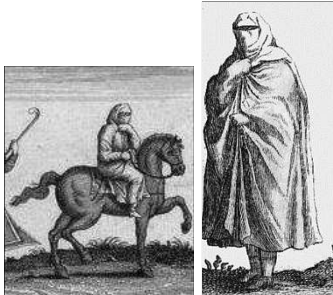
تصویر ۷ و ۸: تصاویری از سفرنامه شاردن که چادر زنان را نشان می‌دهد.

همچنین آمده است: «... زنان چهار نوع حجاب دارند که دوتا در خانه و دوتای دیگر در بیرون کاربرد دارد. اول روسری سفیدی که برای زینت تا پشت بدن نیز می‌افتد، دومین پوشش از زیر چانه عبور کرده و سینه را می‌پوشاند. سوم چادری است که تمام بدن را فرا می‌گیرد. چهارم پارچه دستمالمانندی است که صورت را می‌پوشاند و به هنگام تشراف به اماکن متبرکه کاربرد دارد» (فریه، ۱۳۸۴: ۲۴۳).