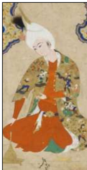
تصویر ۱۳: شاهزاده ملبس به قبای زربفت، محمد هروی، اواسط قرن ۱۰ (هق)، گالری هنر فریه واشنگتن.