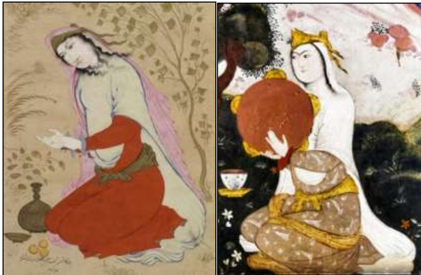
تصویر ۹: راست، بخشی از دیوارنگاره کاخ چهل ستون که مقنعه زنان را می‌نماید، اوایل قرن ۱۱ (ه.ق). تصویر ۱۰: چپ، زنی در حال شمردن با انگشتانش، معین مصور، قرن ۱۱ (ه.ق)، موزه بریتانیا

از آنجاکه در تصاویر به‌جامانده از دوره‌های قبل این نمونه از چادر و مقنعه دیده نمی‌شود، به نظر می‌رسد در این دوره با رسمی شدن مذهب شیعه، زنان مسلمان شیعه به جهت رعایت حجابی که در آیین آنان وجود دارد، هنگام خروج از منزل با چادری بلند و سفید که سراسر بدن را می‌پوشانده از منزل خارج می‌شدند. بنابراین می‌توان مذهب را به‌عنوان عاملی در تفکیک دو نوع پوشش زن در منزل و بیرون از منزل به شمار آورد. باید به این نکته اشاره کرد؛ در نگاره‌هایی که از کاخ‌های این دوره به چشم می‌خورد، زنان آزادانه‌تر تصویر شده‌اند و می‌توان گفت علت شاید آن باشد که تصاویر در داخل ابنیه محفوظ بوده و توسط افراد خاصی که عموماً اهل خانه بودند دیده می‌شده است.