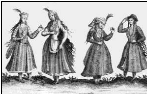
تصویر ۲۲: تن پوش زنان در تصاویر سفرنامه شاردن، (مأخذ: en.wikipedia.org)

در ادامه این قرن، انواع جدیدی از لباس‌های اصلی در پوشاک مردان به وجود آمد. نوعی نیم‌تنه کوتاه آستین‌دار به تدریج جایگزین جبه بلند شد، تمام سینه را می‌پوشاند و در دو طرف بسته می‌شد (یار شاطر، ۱۳۸۲: ۲۰۴-۲۰۳). اما اغلب آن را به صورت آزاد روی شانه می‌انداختند، که اغلب آستین‌ها به جلو و عقب تاب می‌خورد (پوپ، ۱۳۸۷: ۲۵۹۰). (تصویر ۲۳ و ۲۴) به نظر می‌رسد این نوع تن پوش در تقلید از نوعی شنل اروپایی پوشیده می‌شده است.