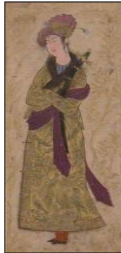
تصویر ۱۵: تصاویر یک آلبوم که نقوش زیبای تن پوش را نشان می‌دهد، اوایل قرن ۱۷، موزه متروپلیتن نیویورک.

استفاده ماهرانه از بافت‌های پیچیده، ترکیب رنگ‌های مختلف با یکدیگر و نوآوری در طراحی پارچه سبب تولید منسوجات بی‌نظیر شد همچنین تأسیس کارگاه‌های متعدد بافندگی در اصفهان و شهرهای دیگر که در آن‌ها منسوجات و شال‌های ابریشمی بافته می‌شد، میزان تولید پارچه‌های نفیس و گران‌بها را افزایش داد (کبیری و بروجنی، ۱۳۹۰: ۹۰).