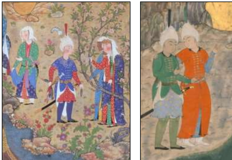
تصویر ۱۸: راست، بخشی از نگاره بزم اسکندر، خمسه نظامی، قرن ۱۰ (ه.ق)، موزه متروپولیتن نیویورک. تصویر ۱۹: چپ، تدبیر کنیزکان رودابه برای دیدار با زال، قرن ۱۰ (ه.ق)، منسوب به میر مصور، شاهنامه شاه‌طهماسبی.

در ادامه به شرح مختصری از این تحولات ایجاد شده در تن‌پوش زنان و مردان دوره صفوی پرداخته می‌شود: در نگاره‌های موجود در اوایل دوره صفوی غالباً تصویر مردان را در لباسی جلو بسته که کل بدن را تا مچ پا می‌پوشاند و این پوشش قبا یا خفتان نامیده می‌شد، مشاهده می‌کنیم. قبا جامه‌ای است، که درازای آن تا روی قوزک پا می‌رسید و آستین‌های بلند آن از سرانگشتان می‌گذشت. در بعضی موارد اقتضای ادب چنین بود که در حضور فردی از طبقه بالاتر دست‌ها را بپوشانند. در این تصاویر دو نمونه قبا مشاهده می‌شود: قبای ساده جلو باز و قبایی که به‌طور مورب در زیر بغل باز و بسته می‌شود (تصویر ۱۸ و ۱۹).