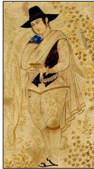
تصویر ۲۵: جوان در لباس اروپایی، هنرمند (?)، قرن ۱۱ (ه.ق)، موزه بریتانیا