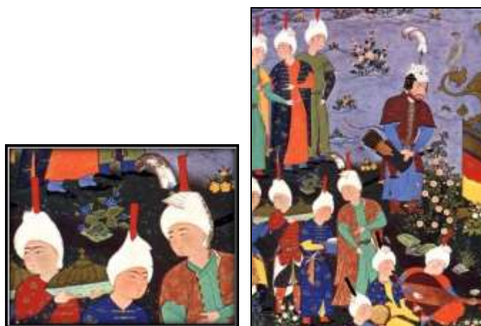
تصویر ۳: بخشی از یک نگاره شاهنامه شاه طهماسبی، درباریان با کلاه قزلباش، قرن ۱۰ (هق)، مأخذ: شاهکارهای نگارگری ایران.

شکل آن از آغاز سلطنت صفویان تا پایان آن به تدریج تکامل یافته است (غیبی، ۱۳۸۵: ۴۱۰). (تصویر ۳ و ۴)