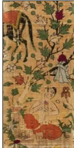
تصویر ۱: راست، مخمل با طراحی نگاره آب‌تنی شیرین، قرن ۱۰ (ه.ق)، موزه متروپلیتن